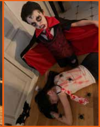
Lauréate de la photo MEILLEUR MISE EN SCÈNE