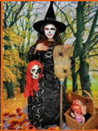
Lauréate de la photo MEILLEUR DÉCOR