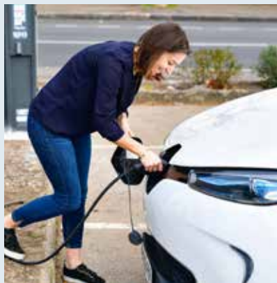
GRILLE TARIFAIRE APPLICABLE AU 1 ER SEPTEMBRE 2020

temporalité et le service de recharge le plus adapté. Vous serez consultés prochainement sur l'usage actuel d'un véhicule électrique, votre intention d'en acquérir un à horizon de deux ans, votre besoin potentiel de bénéficier de bornes de recharge et votre localisation. L'avenir de Margency s'écrit aujourd'hui avec votre contribution.