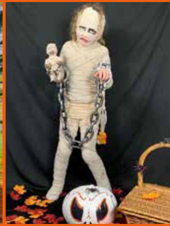
Lauréate de la photo MEILLEUR DÉGUISEMENT