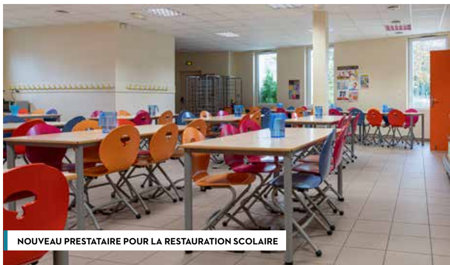
NOUVEAU PRESTATAIRE POUR LA RESTAURATION SCOLAIRE

D'autres dépenses sont déjà anticipées pour préserver et entretenir notre patrimoine avant qu'il ne se dégrade et génère des travaux à plus gros budget.