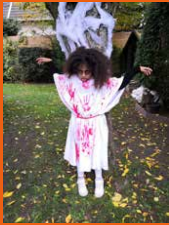
Lauréate de la photo LA PLUS TERRIFIANTE

Découvrez les lauréats et participants au concours photos organisé pour Halloween suite aux contraintes sanitaires.