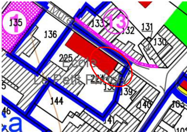
Extrait du plan de zonage proposé dans la modification simplifiée N°1 du PLU