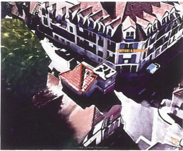
REPERE 00 : VUE AERIEUNE TOITURE & IMMOBILIER